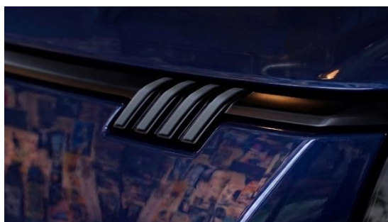
〈フロント 4 ストライプバッジ〉

エクステリアには、FIAT バッジやモデルバッジに用いられるカラー「ガン メタリック」と調和する専用アクセントデカールを採用しました。耐久性と質感に優れたハイボスカル素材を使用し、フロント、サイド、ホイールに配することで、機能美と精悍な存在感のあるスタイリングを演出しています。加えて、車両後方のサイドレールカバーをブラックで仕上げることで、ブラックのドアハンドルと呼応したアクセントをつくり、サイドビュー全体を引き締め、都会的で上品な佇まいを際立たせています。