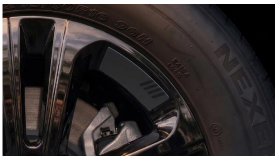
〈ホイール アクセント〉