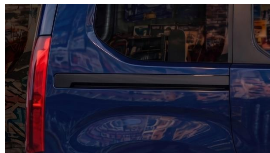
〈ブラック サイドレールカバー〉

新たに搭載された機能が、「DOBLÒ」として初採用となるグリップコントロールです。エコ、ノーマルに加え、スノー、マッド、サンドの全5つの走行モードにより、前輪駆動ながらも路面状況に応じた適切なトラクションを確保し、悪路でも安定した走行をサポートします。これにより、様々な路面状況においても安心感のあるドライビングを実現し、より幅広いシーンでの活用を可能にします。