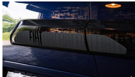
〈サイド ドアガーニッシュ デカール〉