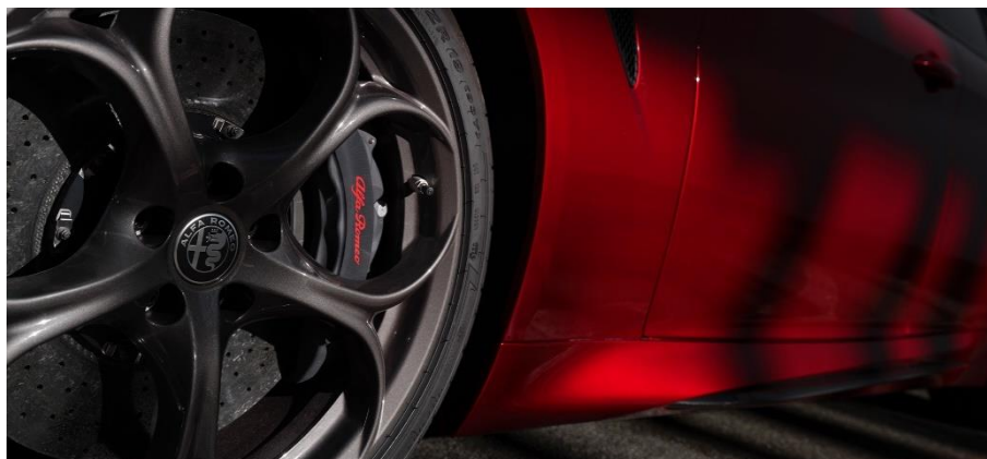
*画像は「GIULIA Quadrifoglio Collezione」

ブレーキキャリパーには、高い信頼性と優れた仕上げで知られる Brembo（ブレンボ）製のブラックのキャリパーを採用した上、特別なアノダイズド加工（アルマイト加工）を施し、赤い Alfa Romeo ロゴを配しました。アノダイズド加工とは、アルミニウムの表面に強固な酸化皮膜を形成する処理であり、高い耐久性と放熱性を備えるレース由来の技術です。マット調ながら金属の質感を残す独特の仕上がりが、外装のカーボンパーツと調和し、精悍な印象をいっそう引き立てます。