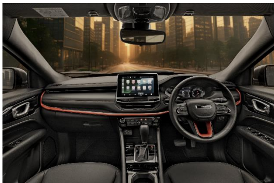
＜レッドとブラックのインストルメントパネル＞