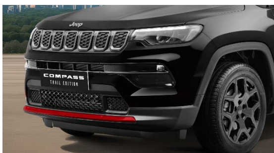
＜フロントフェイス下部 レッドアクセント＞

インテリアにもそのこだわりを込めました。レッドステッチを施したシートに加え、インストルメントパネルにもレッドとブラックの配色を取り入れ、外装と調和するデザインに仕上げました。エレガントなデザインとコントラストの効いた配色で、限定車ならではの特別な一台です。