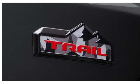
＜専用 TRAIL バッジ＞