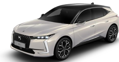
<クリスタルパール>

煌びやかな夜景を思わせる「クリスタルパール」（30 台限定）と、人気の高い「ブランナクレ」（40 台限定）の 2 色展開です。