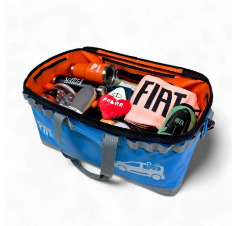
<ソフトマルチコンテナ>