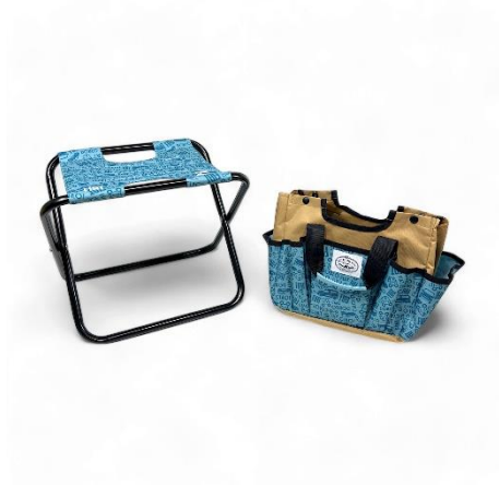
<マルチユーティリティチェア>