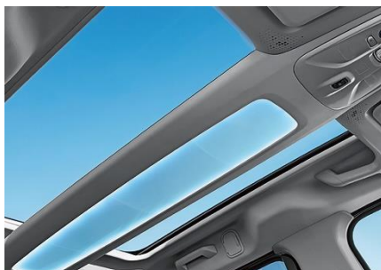
<Magic Top（固定式ガラスルーフ）>