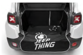
<ラゲージフルカバー>

さらに、130mm サイズの「Duck トイ」を車載し、ユーモア溢れるモデルとなっています。