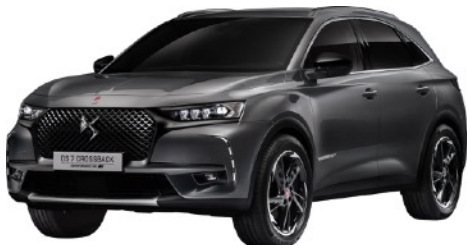
グレイ プラチナム