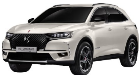
クリスタルパール