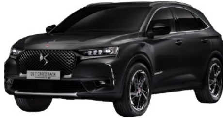
ノアールペルラネラ

※写真はすべて欧州仕様車です。 ※アルカンタラは、イタリアおよびその他の国で登録されたAlcantara S.p.A.の商標です。