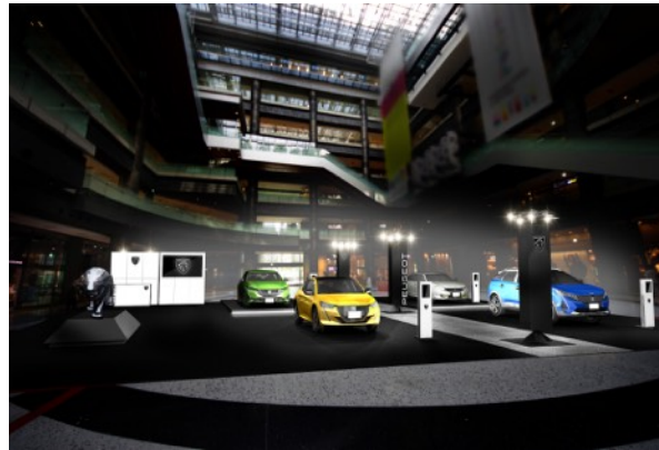
大阪会場イメージ

*本リリースにおける「電動車」「電動化」（英語：electrifiedなど）は、動力源として、ICE（Internal Combustion Engine：内燃機関）に加えて電気を使用したハイブリッド（HEV）、プラグイン・ハイブリッド（PHEV）、燃料電池車（FCV）などを含む表現です。必ずしもバッテリーと電気モーターのみを動力源とした電気自動車（BEV、フルEV）だけを指すものではありません。