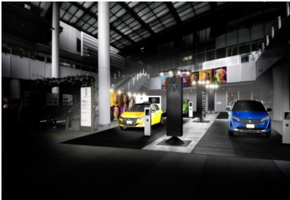
名古屋会場イメージ