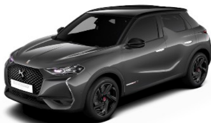
グリ プラチナム／ノールベルラネラ