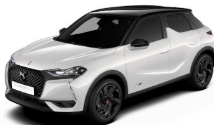
ブランパールナクレ／ノールベルラネラ