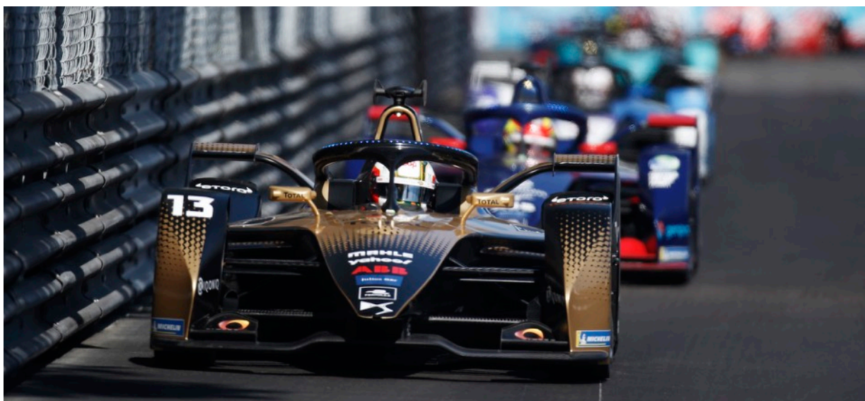
2021年度フォーミュラE ラウンド7 モナコE-Prixにてポール・トゥ・ウィンを飾ったアントニオ・フェリックス・ダ・コスタ／DS TECHEETA

なお、車線内の任意の位置を設定できキープするDSドライブアシストなどのADAS（先進運転支援システム）、ヘッドアップディスプレイなどの装備はDS 3 CROSSBACK E-TENSE Grand Chicに準拠しています。フレンチラグジュアリーブランドならではのエレガンスに、内なるレーシングマインドとEVならではの静粛性を備えたハイパフォーマンスを秘めたDS 3 CROSSBACK E-TENSE PERFORMANCE Line。ガソリンエンジン仕様以上にDSオートモビルのDynamic Serenity（冷静なるダイナミズム）を具現化した特別な一台です。