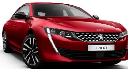
508 GT HYBRID

このコラボレーションプロジェクトにともない「接吻 / Original Love & Ovall」とOriginal Loveの最新曲「ソングライン / Original Love」をバックに田島貴男（Original Love）がプジョー508 GT HYBRIDをドライブする2篇のスペシャルムービーも同時公開いたします。