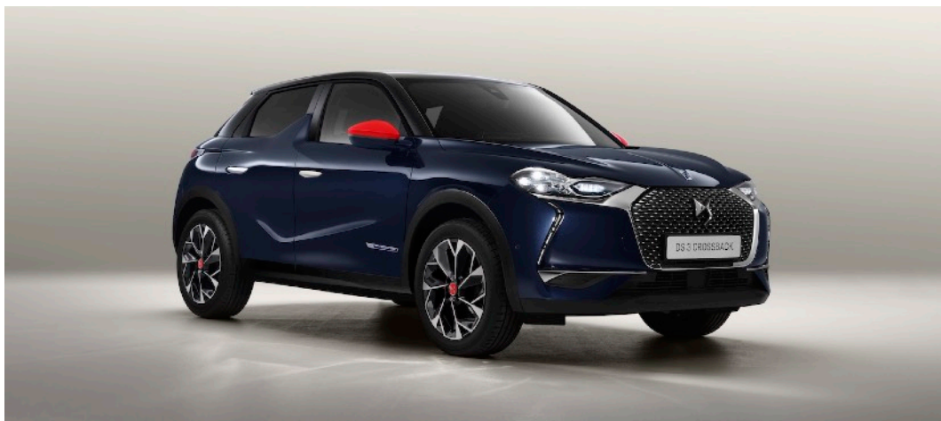
DS 3 クロスバック イネス・ド・ラ・フレサンジュ（ブルー アンクル）