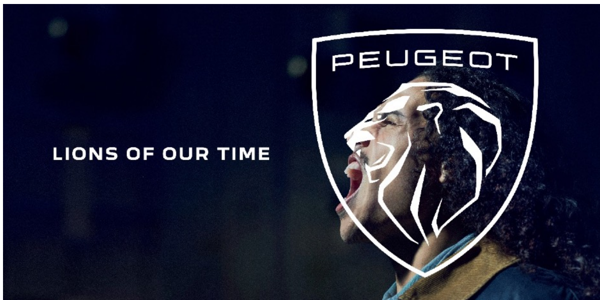
LIONS OF YOUR TIME brand campaign

プジョーは、ブランドキャンペーン“THE LIONS OF OUR TIME”を通じて、カスタマーにとってもっとも貴重な資産である“時間”にさらなる力を提供することを目指しています。単なる時間を、より、体験型で有意義な、質の高い時間に変えられるようにする、それがこのキャンペーンのメッセージです。イノベーティブなハイエンドジェネラリストブランドを謳うプジョーは、オンラインでも、車内でもディーラーでも、一分一秒すべての時間を型にはめることない特別なものとして提供できるのです。