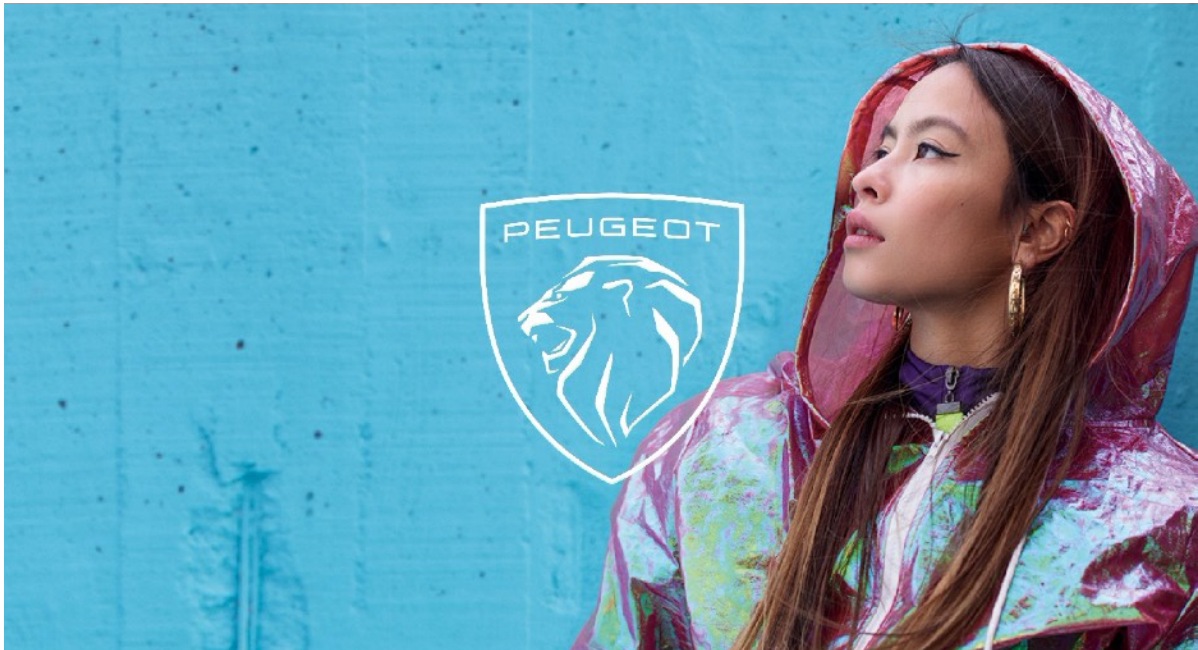
PEUGEOT New Brand Identity

この紋章を掲げることでプジョーは新たな領域へ参入し、国際的な進出を加速させ、フランスならではのスタイル、ノウハウ、そしてフランスの生活の智慧（サヴォワール・ヴィーヴル）を世界に向けて発信することに挑みます。プジョーブランドはその歴史の中で、新たな時代へ向かい、新たなページをめくることとなるのです。