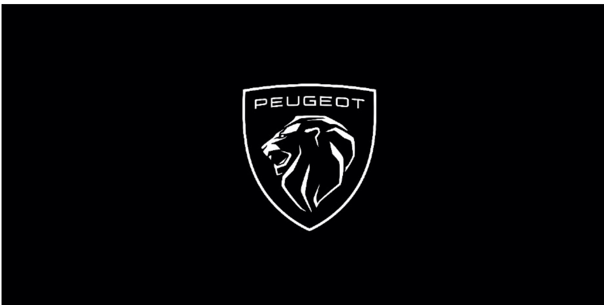
The new PEUGEOT logo

今回の新しいブランドロゴは、これまでにプジョーを築き上げてきたもの、現在のプジョーを成しているもの、そして未来のプジョーを創りあげていくものすべてが具現化されたものです。