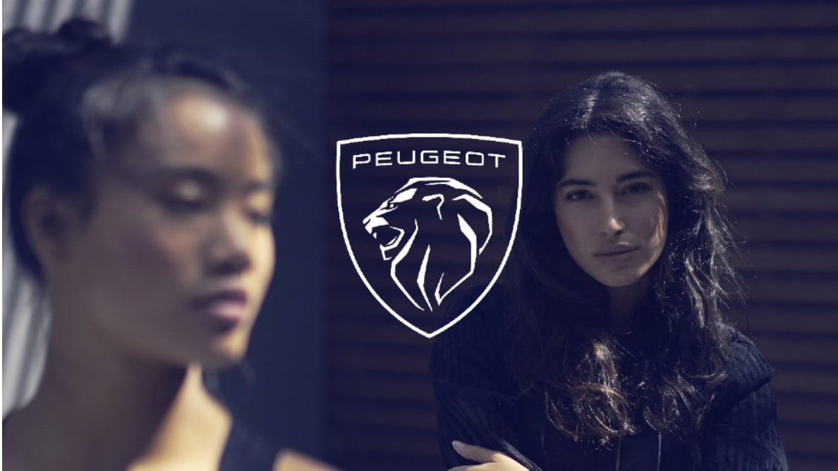
PEUGEOT New Brand Identity

プジョーはまた、そのライオンの紋章が象徴するように力強く直感に訴えるブランドでもあります。