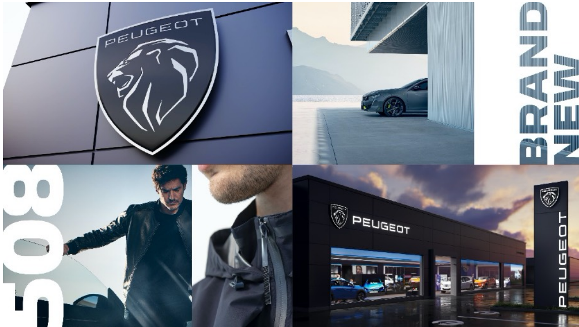
PEUGEOT New Brand Identity

現存する世界でもっとも歴史あるブランドであるプジョーは、刷新されたブランドロゴでその個性とキャラクターをさらに主張します。プジョーのあたらしい歴史のページがめくられます。