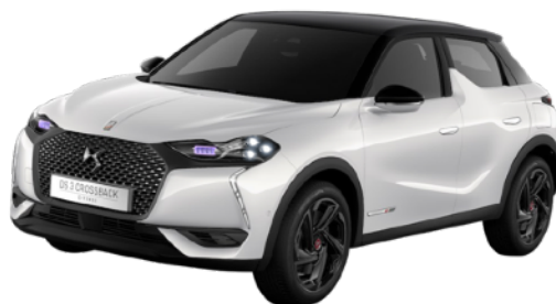
ブランパールナクレ／ノアールペルラネラ