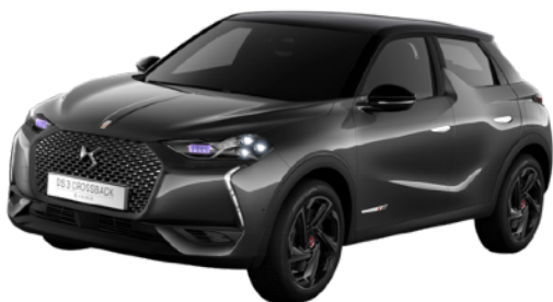
グリ プラチナム／ノアールペルラネラ