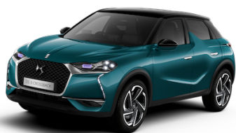
DS 3 CROSSBACK