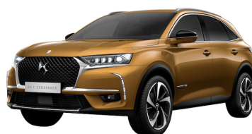
DS 7 CROSSBACK