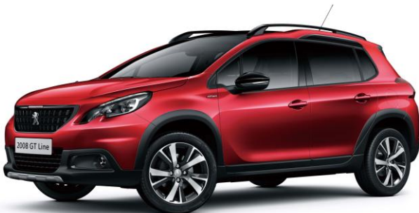
&lt; GT Line &gt;

搭載するパワートレインは、2015 年、2016 年とインターナショナル・エンジン・オブ・ザ・イヤーを連続受賞した、最高出力 110 馬力のピュアテック 1.2L 3 気筒ターボエンジンに第 3 世代の 6 速オートマチックトランスミッションを組みあわせ、力強さと軽快さをバランスよく両立しています。さらに、GT Line はグリップコントロールとその性能を最大限に引き出す 4 シーズンタイヤを装着し、街中での快適性、高速走行時の加速、悪路や雪道での走破性など、様々な条件下での走行性能を向上させています。