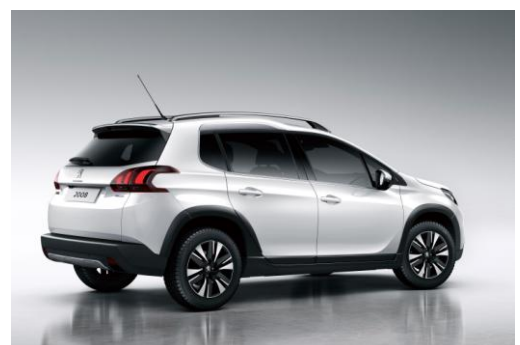
&lt; Allure &gt;