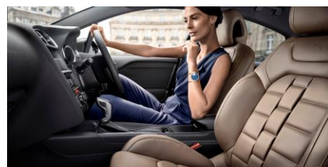
クラブレザーシート(オプション)