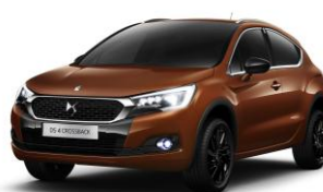
DS 4 CROSSBACK