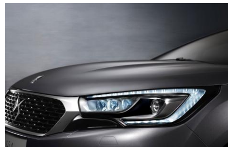
DS WING & DS LED VISION

さらに DS 4 は、シート形状やデザインのディテールにもこだわっています。オプションのクラブレザーシートは最高級とされるセミアニリンレザーを贅沢に使用、時計のストラップをモチーフに一流の職人が手掛けたステッチや仕上げはパリ生まれのオートクチュールをイメージしています。他にも大容量 370ℓのトランクルームや左右独立調整式エアコンなど使い勝手の良さと快適性も追求しています。