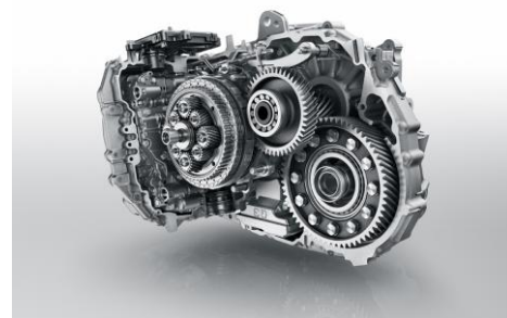
EAT 6 (Efficient Automatic Transmission)