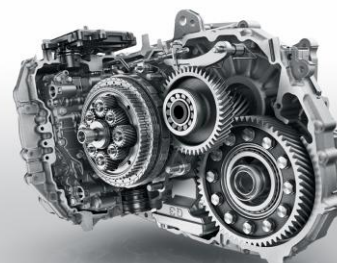
EAT 6 (Efficient Automatic Transmission)