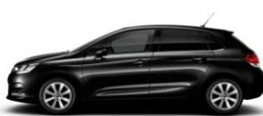
ノールペルラネラ