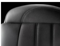
コンビネーション(ミストラル)