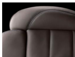
クラブレザー(クリオロ)