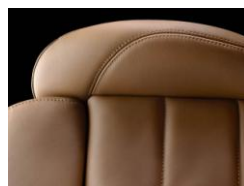
クラブレザー(フォヴ)