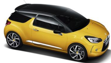
DS 3 Sport Chic