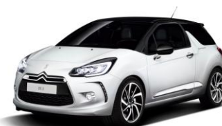
DS 3 So Parisienne