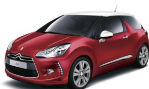
DS 3 Chic