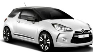
DS 3 Chic Xenon Full LED Package