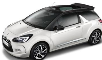
DS 3 CABRIO So Parisienne